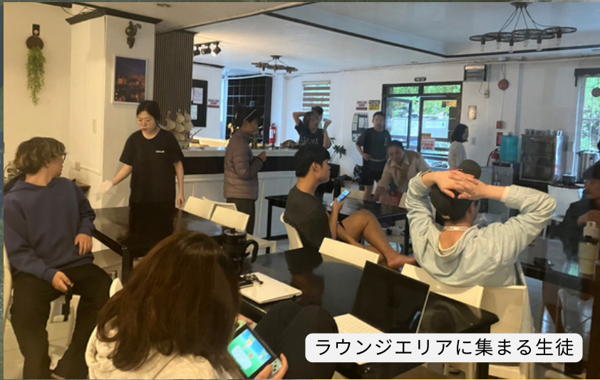
ラウンジエリアに集まる生徒