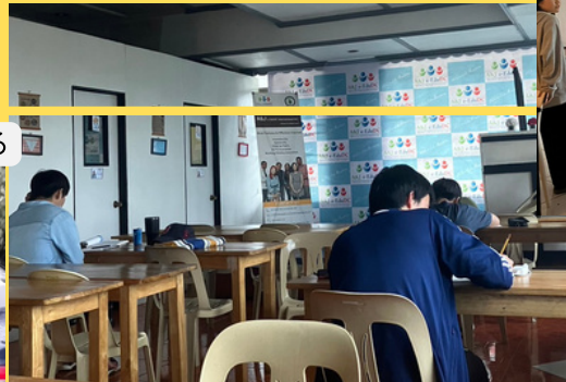
台風の中、勉強する生徒