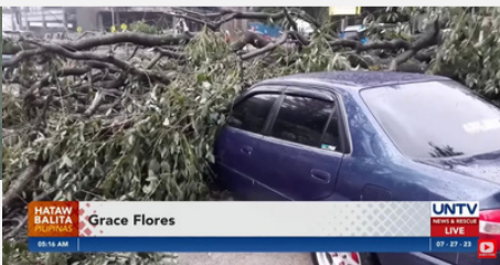
バギオ市内は木が倒れる被害が出ている