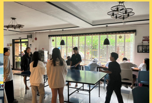
卓球台で遊ぶジュニアコースの生徒