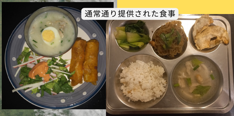
通常通り提供された食事

早朝の市長の発表により、休校の連絡を全生徒に行いました。停電は続いていましたが、学校にジェネレーター（自家発電機）があるので、キッチン、ラウンジ、スタディエリアに電気を通して皆で過ごしました。キッチンは3回の食事の提供を通常通りに行いました。生徒は自習勉強をしたり、卓球や学校にあるカードゲームなどをして過ごしました。21時半に点呼を行い、22時に一斉消灯を行いました。