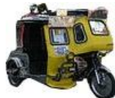
トライシクル 料金交渉制