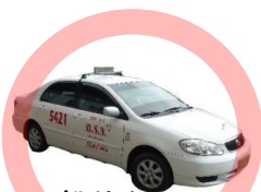
一般的なタクシー 初乗り40ペソ

フィリピンにはジプニー、タクシー、トライシクルなどの公共交通手段があり、基本料金+距離に応じた料金を支払います。学生のみなさんには、タクシーの利用をお勧めします。初乗り料金は40ペソ(約120円)です。Grabというアプリを利用すれば、より安全で便利な移動が可能です。